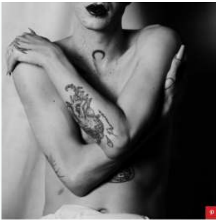
Francesca Schiavone - Benito Pesenti